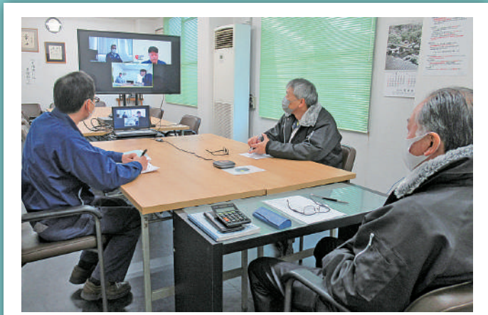
オンライン (Web会議・Web研修等)