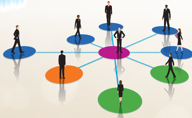
8 ゴールドアゲイン株式会社