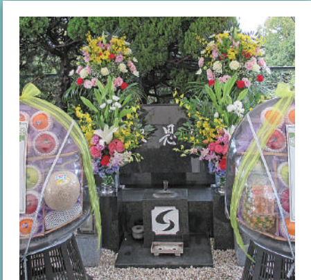
物故者報恩碑 (ゴールドグループ在籍者)