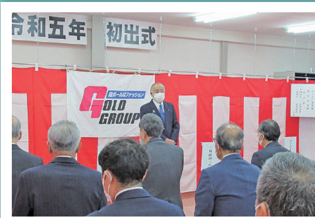
ゴールドグループ初出式